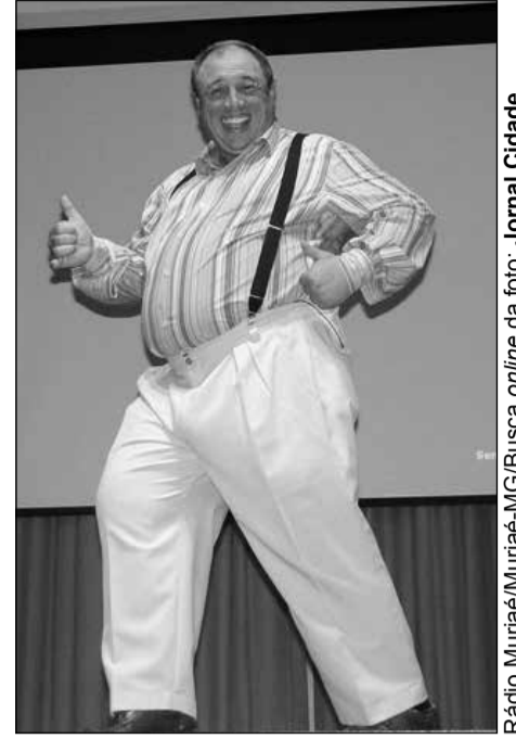
Rádio Muriae/Muriae-MG/Busca online da foto: Jornal Cidade

Humorista Nerso da Capitinga: na sede da Feira Coberta, no Centro de Alto Horizonte, 20h, com entrada franca