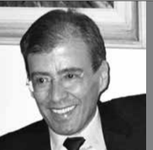
Imagem... - Hoje