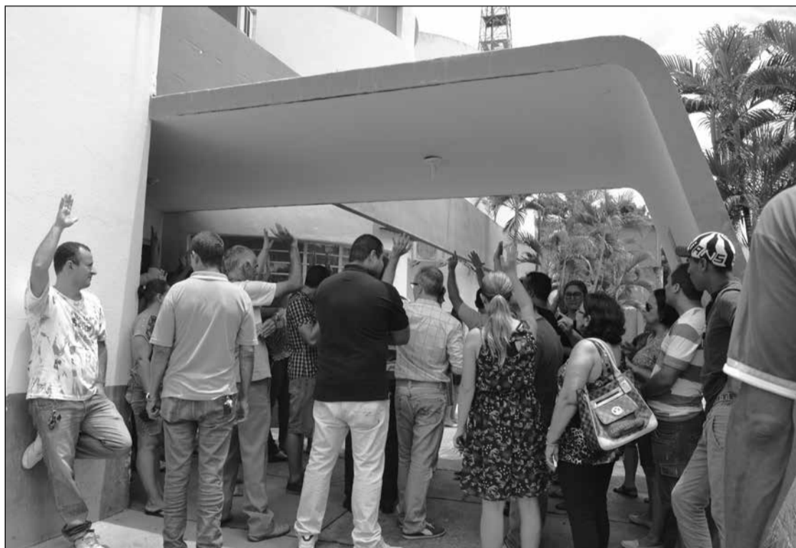
Manifestação de servidores públicos municipais: busca por salários e outros direitos atrasados

Mandado de segurança: na ação, pediu-se o pagamento de salários e 13º salário atrasados de parte dos servidores. Solange assinou a notificação (parte inferior do documento da Justiça, à esquerda)