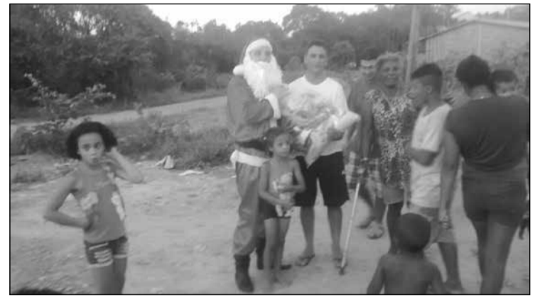
Gratidão: mais que doação de alimentos: esperança, carinho...