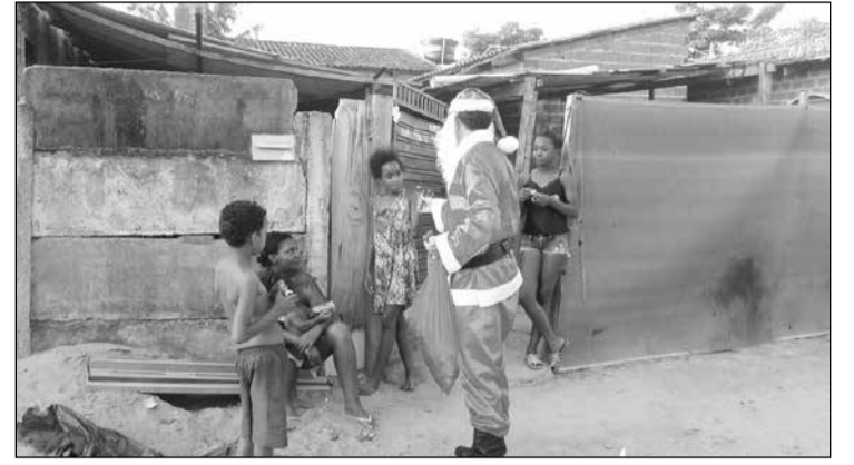
Famílias contempladas residem em áreas periféricas de Uruaçu

Associação Beneficente Casa Grande realizou a ação em conjunto com o Grupo Escoteiro Manoel Fernandes de Carvalho