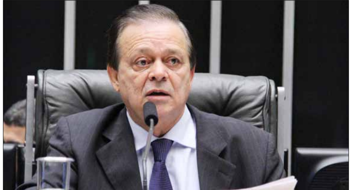
Goiano e do PTB, Jovair Arantes está na disputa pela presidência da Câmara dos Deputados