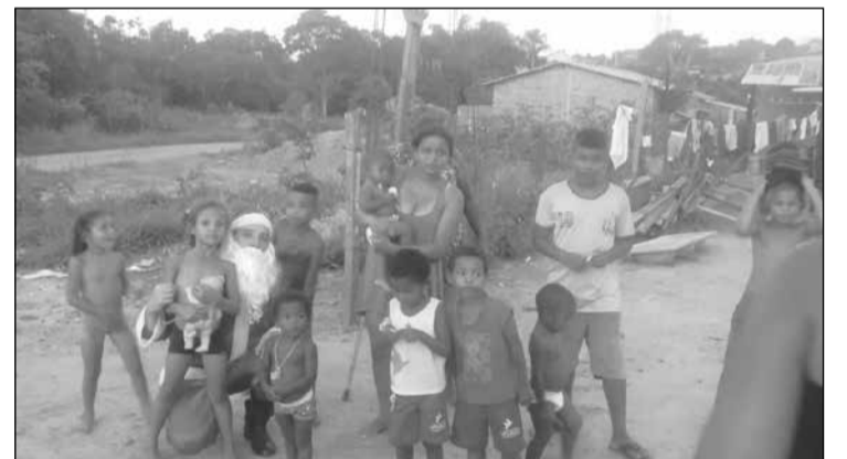
Visão: construção de mundo mais justo e igualitário para todos