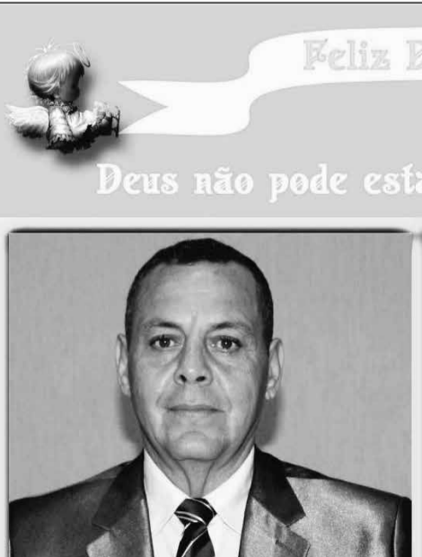
Alacir Freitas Carvalho Presidente - PSDB