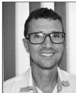
PROFESSOR GIGI Uruaçu (Goiás)

Enfim, se a era Trump criou as chamadas pós-verdades, nossos políticos e empreiteiros corruptos criaram as chamadas pré-mentiras, que antecedem as pós-verdades. Já somos exportadores de muitas frutas exóticas, agora temos mais essas jabuticabas, que só vingam, florescem e amadurecem aqui no Brasil.