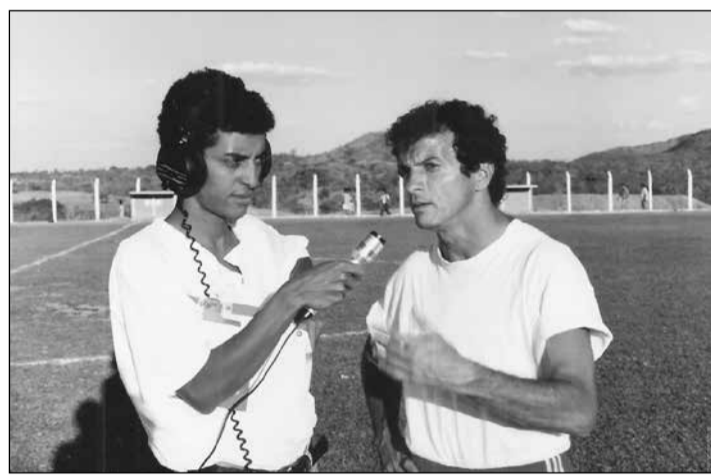
César Moreira/Foto Tocantins (Uruaçu)