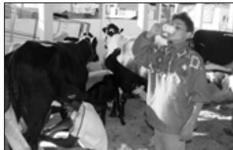
A competição foi uma das atrações da Expo/2007