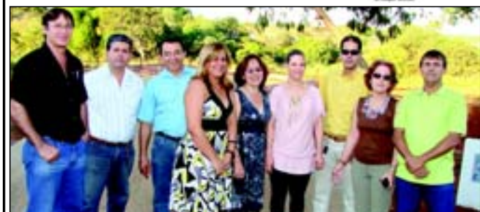
Solange/parte dos diretores associados, quando do lançamento da pedra fundamental da Aciau