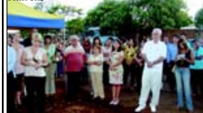
Evento da Aciau: vários segmentos foram representados

Dia 3 de julho, a Associação Comercial, Industrial e Agropecuária de Uruaçu (Aciau) lançou a pedra fundamental para construção de sua sede própria. Na data, as obras já estavam em andamento com parte das paredes levantada. As instalações, localizadas, na rua 4, lote 1-A, quadra 7, bairro Copacabana, na parte Sul da cidade, estão previstas para serem inauguradas dentro do segundo semestre deste 2007. Um feito que será aberto ao público.